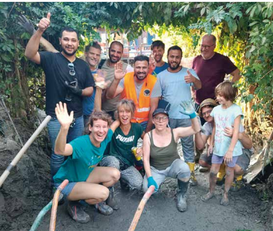
Die Freie Syrische Gemeinde Österreichs half nach den Hochwassern im September 2024 bei den Aufräumarbeiten in Kritzendorf und Matzleinsdorf

Noch nie zuvor gemessene Regenmengen setzten weite Teile Österreichs Mitte September unter Wasser. Vom Salzburger Flachgau bis ins nördliche Burgenland und die Obersteiermark gab es große Schäden. Aber auch die Hilfsbereitschaft war und ist enorm.