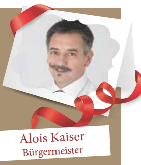
Alois Kaiser Bürgermeister

Frohe Weihnachten und ein gutes neues Jahr wünscht der Bürgermeister und die Gemeindevertreter der Gemeinde Eschenau.