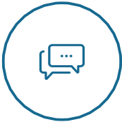
Europäischen Sozialen Dialog

Die Europäische Union hat einen wachsenden Einfluss auf die Entwicklung der sozialen Dienste in Europa durch: